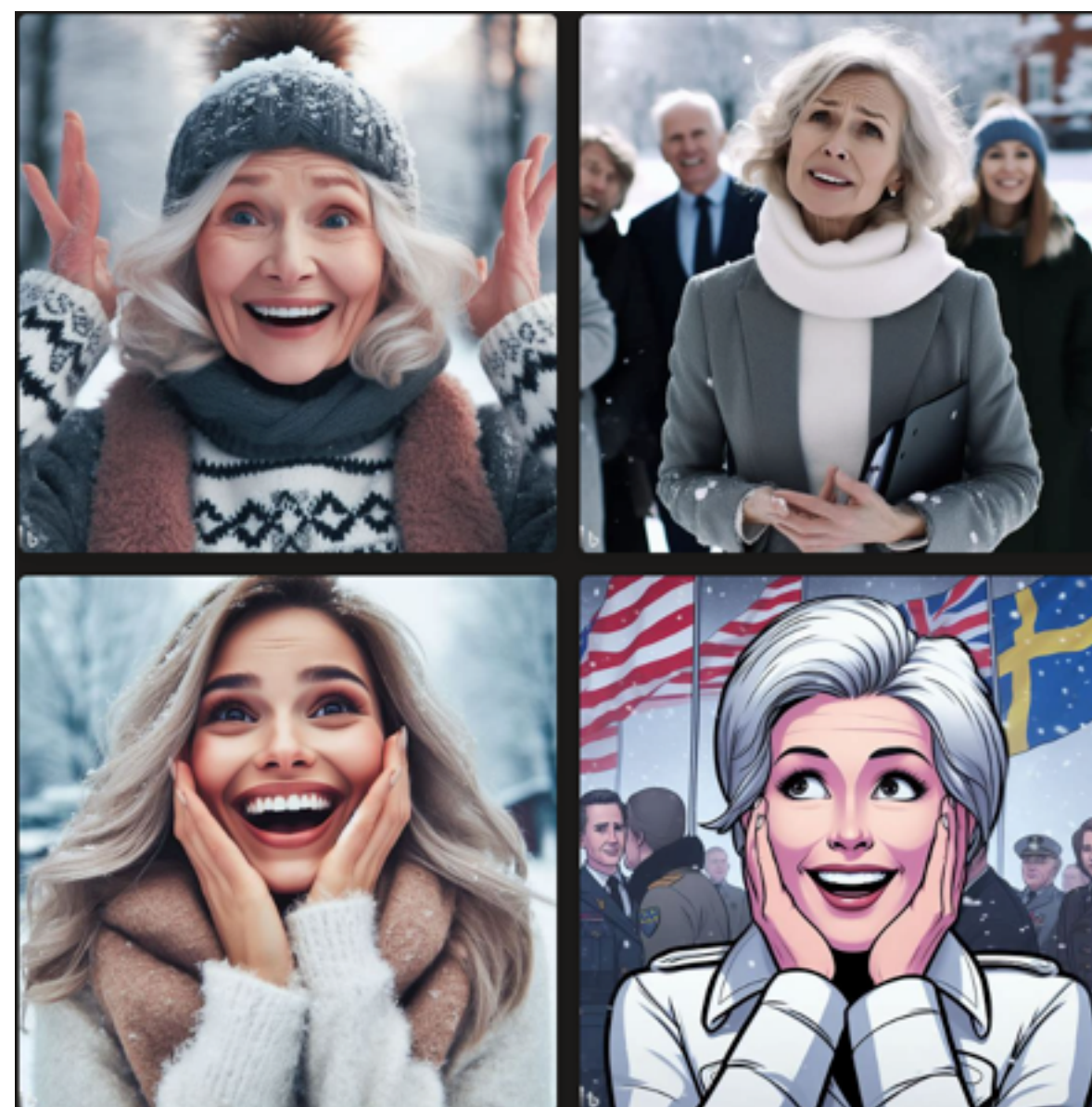
happy cunfused looking female leader in her eighties public sector northern sweden winter Mark V