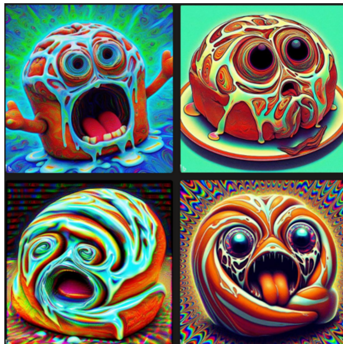
A frenetic cinemon bun asking for mercy before being eaten, psychedelic mode Mark V

Arbeta med sökmotorn BING som använder DALL-E https://www.bing.com/images/create