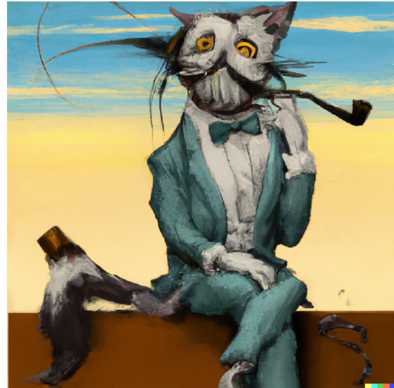
"A fantasy figure in DALLI-style showing what Chat GPT would look like if he was a cat"

Men man bör inte ta det som skrivs för fakta. Den härmar mänskliga texter, men har ingen inbyggd förmåga till källkritik eller sanning.