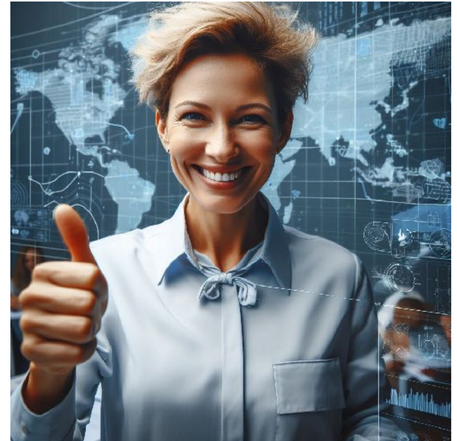
”energetic female leader in her fifties public sector northern Sweden Mark V”