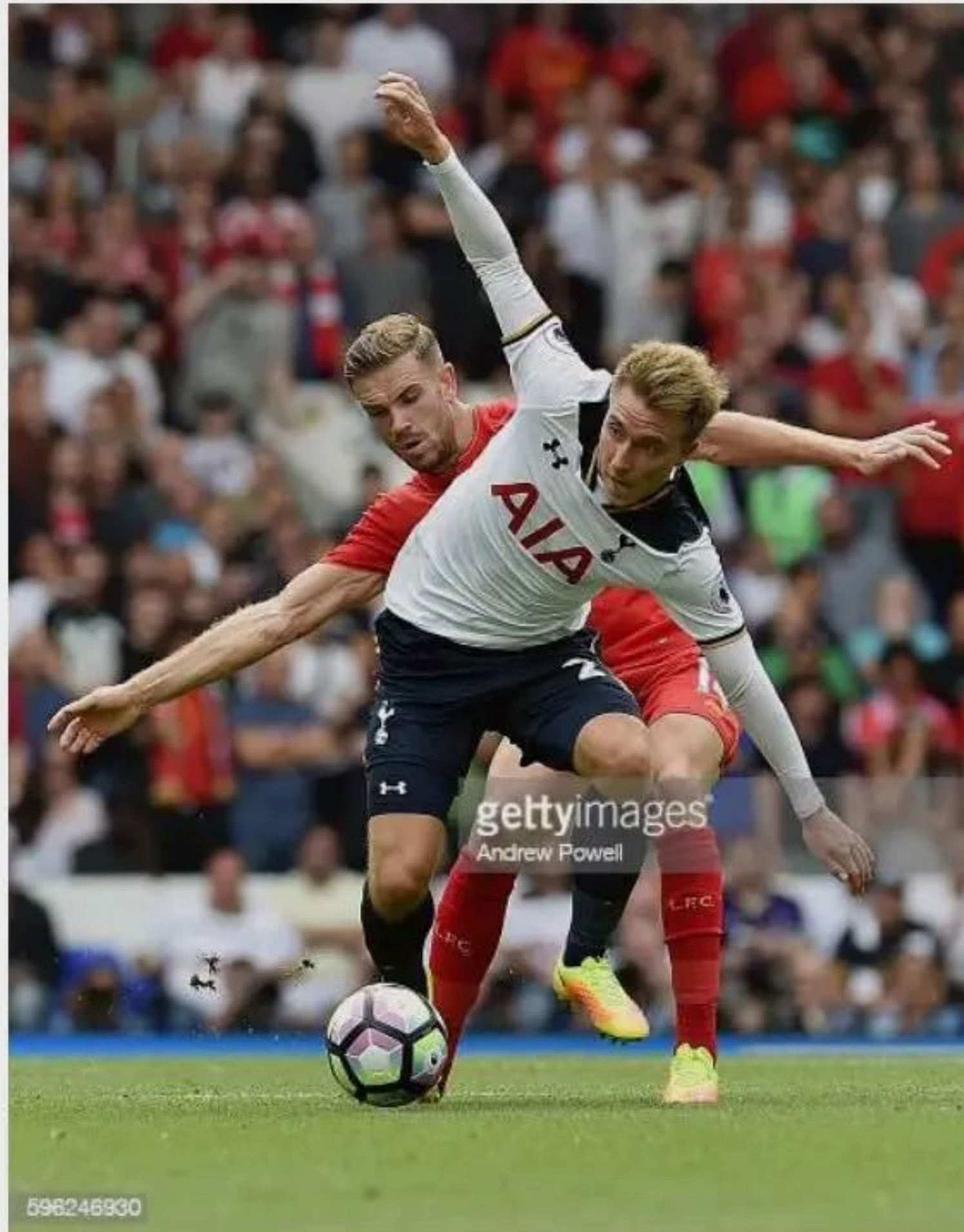
image copied by Stability AI and used to train its model and the watermarked image on the right is output delivered using the model: